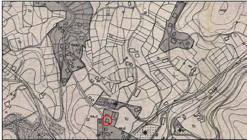
Clasificación del suelo según planeamiento del Ayto. de Pontevedra