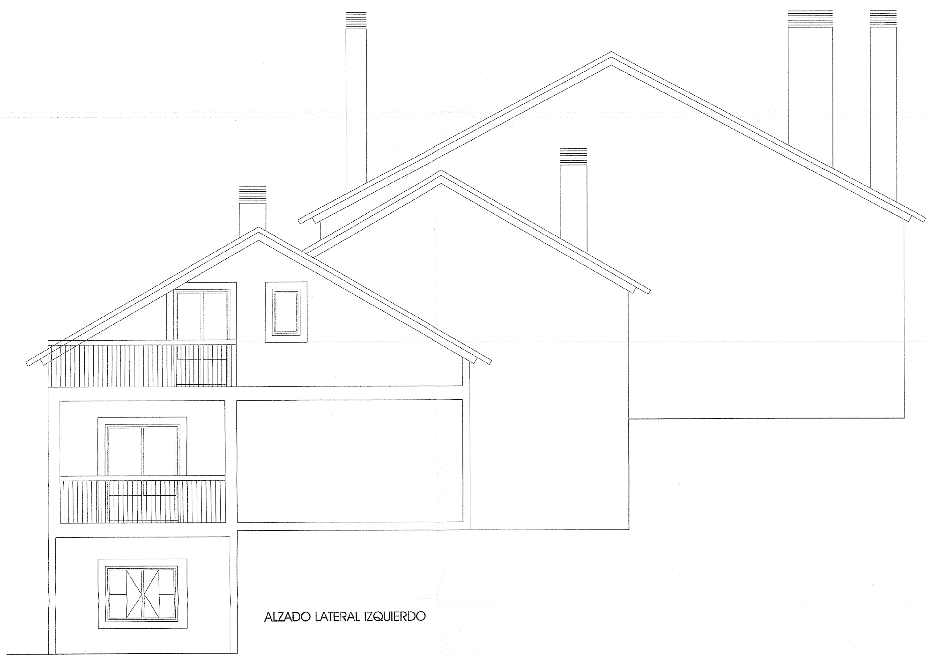
ALZADO LATERAL IZQUIERDO